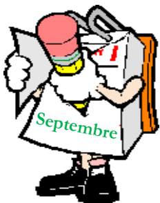
Table de sécurité urbaine de l'arrondissement